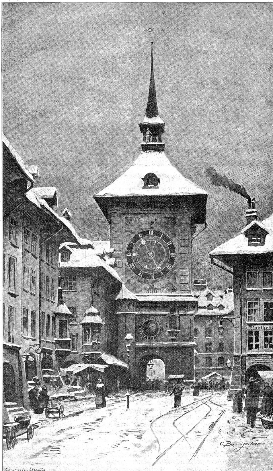
Der Zeitglockenturm im Winter 1894/95.

Vielen aber ging es mit dem Schnee wie mit einer alten Sehnsucht: Wenn sie erfüllt ist, wissen sie nicht, was mit ihr beginnen. Der Schnee wurde ihnen lästig, sie wären ihn am liebsten wieder los. Deshalb das Schaufeln und Schieben der Schneemassen in unserer Stadt, wie wenn sie einem Todfeind auf den Leib rückten. Wer Glück hatte, wurde aufgeschaufelt, mitgeschoben, oder erhielt auf alle Fälle Seitenstöße von den ihn umdrohenden Besen- und Schaufelstielen als Andenken an die langersehnte Schneezeit in Bern. Uebrigens: Zusehen, wie auf unsern Plätzen und Gassen der Schnee zu Haufen getrieben wird, und wie es Menschen gibt, die sich um seinetwillen ärgern können, ist auch ein köstlich Ding. Der eine schiebt bedächtigt, wie es sich für den Ernst