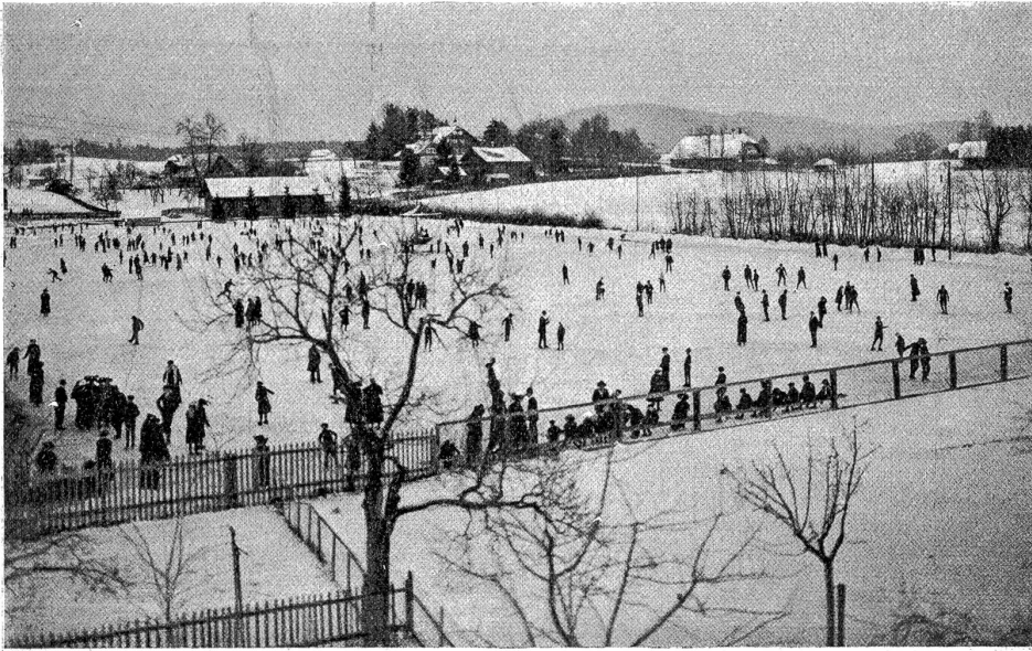
Bern im Winter: Schlittschuhlaufen auf dem Egelmoos.

der Arbeit gehört, wartet auf den Karren, der nicht kommt, nimmt z'Müni und wartet wieder. Der andere schiebt den Schnee zu einem Haufen, läßt ihn stehen und läuft davon.