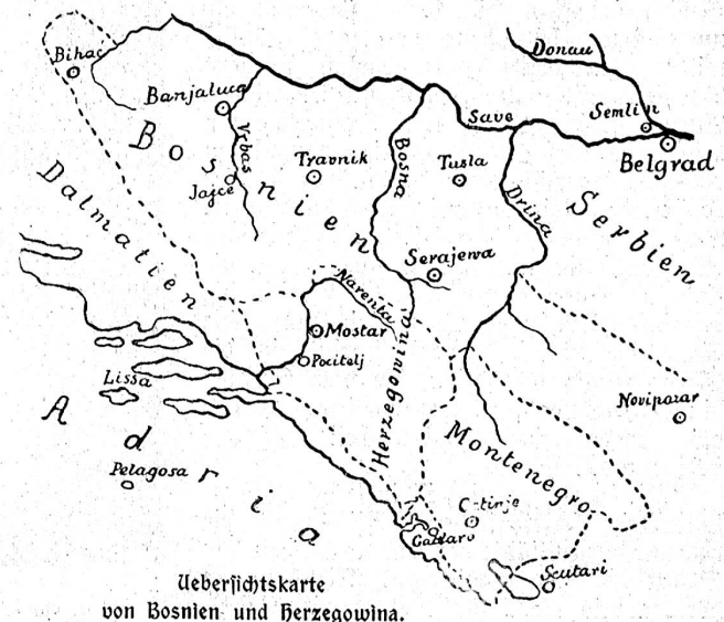
Uebersichtskarte von Bosnien und Herzegowina.

fertigen es, wenn wir unsere Leser mit diesem Teil des Kriegsschauplazes, mit Bosnien überhaupt etwas näher bekannt machen.