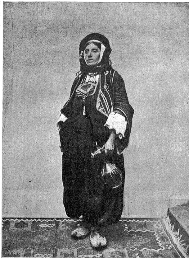
Bosnische, christliche Bäuerin in türkischer Tracht.

Die Neustadt, seit dem furchtbaren Brande von 1879 vollständig neu aufgebaut, ist, wie jede andere Stadt mit guten Straßen, Gärten und Staub. Wer aber von der breiten Anlage Jung-Serajewos ein wenig seitwärts geht, kommt unvermittelt mitten in den Orient. Ueber das Geröll der elenden Gassen finden wir in die Carsija (Scharfscha), dem türkischen Marktplatz und wohl interessantesten Orte der Stadt. In einem wahren Durcheinander schmaler Gäßchen pulsiert hier das Leben eines Basars, wie ihn Kairo nicht origineller und seltsamer aufweisen kann. Es gibt kein orientalisches Handwerk, das hier nicht vor den Augen der ganzen Welt getrieben wird: mit übergeschlagenen Beinen arbeitet der Schuster neben dem Goldschmied, der Sattler