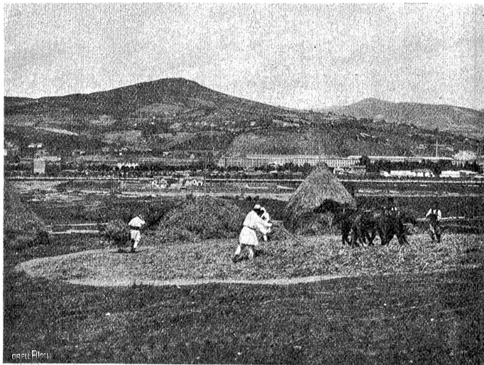
Bauern beim „Dreschen“ von Getreide. — Im Hintergrunde Serajewo.

lesenem Geschmack gefertigt und mit erlesener Ausdauer. In der Teppichweberei sitzen Mädchen an den Stühlen, und an einem weichen, seltsamen Seidentepich arbeitet eine Schü-