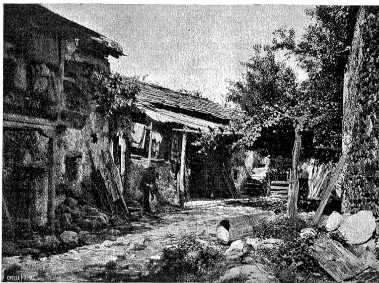
Ein türkisches Dorf in der Herzegowina.

Die Regierung unterstützt den Trieb zum Handwerk, der in den Leuten steckt, durch Schulen. Es gibt deren eine ganze Menge, und die hervorragendsten sind die Ziselaerschule und die Teppichweberei. In beiden werden geradezu wunderbare Arbeiten gefertigt, die nur an Private (nie an Händler) zum Selbstkostenpreis verkauft werden. Man kann da kunstvoll eingelegte Waffen kaufen, Schnallen, Hutnadeln, Gürtelschließen, Waffen und hundert anderen Tand; alles mit er-