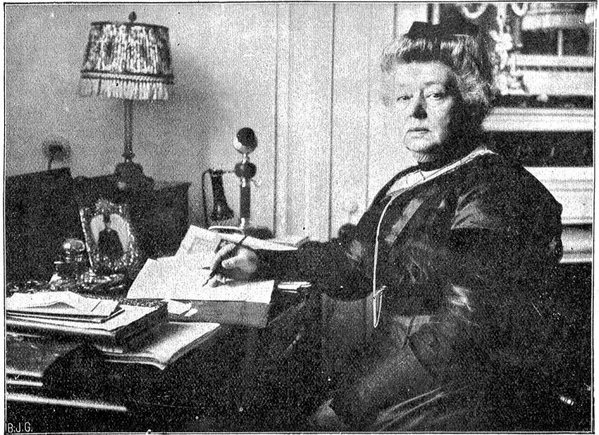
† Berta von Suttner.

Seit 1891 war die Verstorbene un- ausgekehrt für die Friedensbewegung tätig. Auf allen Friedenskongressen war sie zu finden, in Hunderten von Vorträgen in der alten und neuen Welt ist sie für die Idee des Weltfriedens eingetreten. In Oesterreich gründete sie die Oesterreichische Friedensgesellschaft, deren Vorsitzende sie war. Außerdem war sie Vizepräsidentin des seit 1891 bestehenden Berner Internationalen Friedensbureaus, des Mittelpunktes der europäischen Friedensbewegung überhaupt. Im Jahre 1905 erhielt sie den Friedenspreis der Nobelstiftung. In den letzten Jahren wohnte sie in Wien.