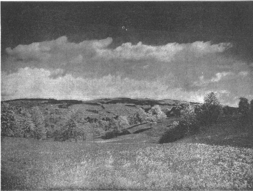
Maientracht im Schweizer Mittelland. Motiv von Hertenstein.