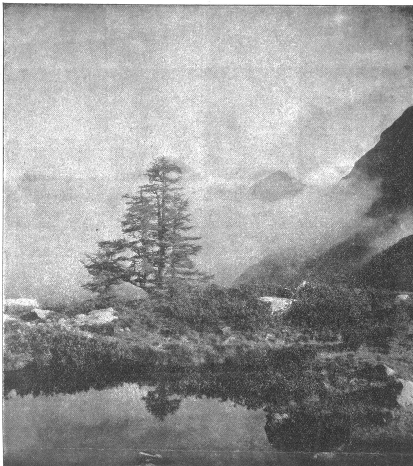
Motiv von der Windegg am Criftgletscher.