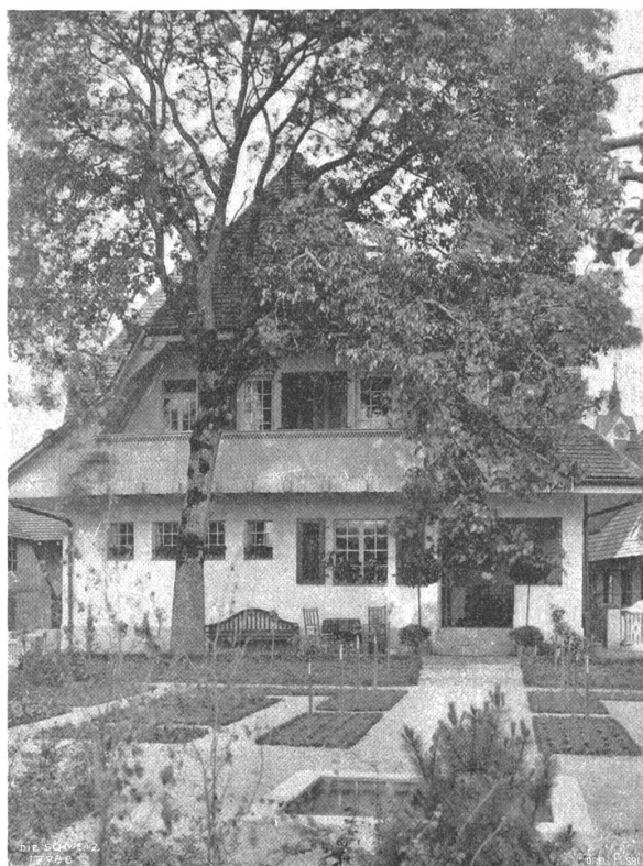
Otto Ingold, Bern. Haus Amiet auf der Oschwand , Südfront u. Garten. Oberaargauer Typus.

Kurzum man liebte Vuillemier nicht, somit mußte er der Schuldige sein. Anfangs bezichtigte man ihn nicht offen der Tat, vielmehr geschah es mit versteckten Reden und gehässigen Andeutungen; man stieß im Vorübergehen an ihn, indem man ihn als „Pourri“, als Verräter und Spion behandelte. Darauf wurden die Quälereien brutaler, direkter, — je länger der Samstag ohne den freien Nachmittag zurückkehrte, in welchem man sonst neue Kräfte sammelte. Der arme Knabe beteuerte seine Unschuld, zuerst bestürzt, dann entrüstet, als er begriff, wessen er beschuldigt ward. Er bezeugte, keinen einzigen Schneeball oder noch viel weniger einen Stein ge-