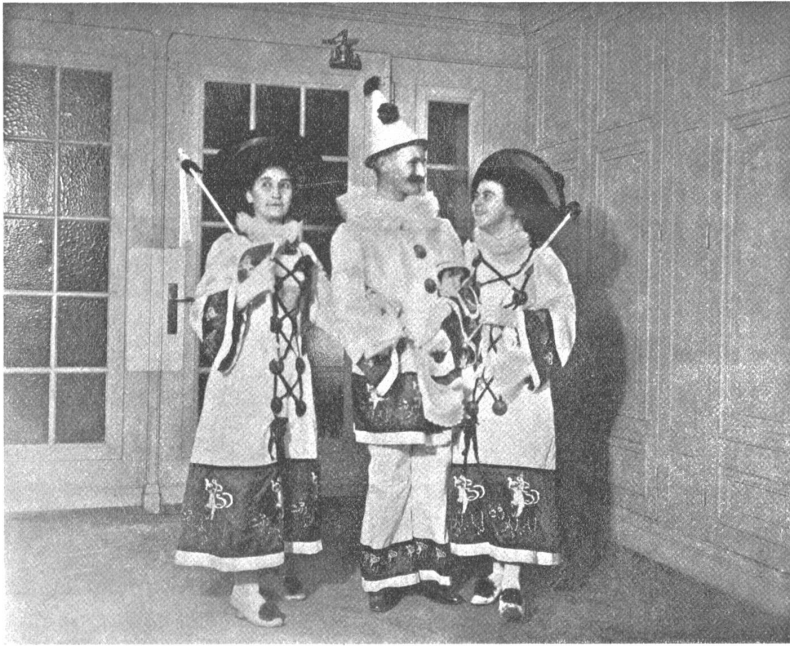
Quodlibet-Maskenball vom 1. Febr. 1913. 2. Preis: Quodlibetgruppe.

von einem Flitter. Ich glaube fast. Oder ergeht es euch anders, waschechtes Mazedonierpaar, oder dir, Indianerin, Hänsel und Gretel, Glühwürmchen, Quodlibetgruppe und „Bibelmärit“? Nein, nein, euch allen ist das bunte Kleid die Gebärde, die große Geste für ein paar Stunden der Tollheit, die euch auf Augenblicke entschädigen, trösten sollen für die Banalitäten des täglichen Lebens. O, wer begriffe das nicht! — Etwa ihr, ihr Männlein alle, im schwarzen Bein- und Frack und weißer Weste, die ihr den Wänden nach steht und die Tapeten schont. O, ihr müden, Bundes-Altenstaub gewonten Augen, blendet euch das bunte Farbenpiel? Und doch seit ihr alle da, ihr lieben Bekannten: Da ist der Mörgler, Kritiker und Philosoph, der Mucker, Kannegießer, der Pedant, Philister und der alte Grillenfänger! Nicht war, ihr habt es alle bitter nötig, das Lachen wieder zu erlernen. Still, still, ich weiß, der Mensch will auch einmal etwas anderes sein, als wie er im Adressbuche steht. Die Geheimseele regt sich unter den gebürsteten Kleidern und ihr sucht hier die Wunder, die ihr euch ausgemalen in weißen Nächten im stillen Kämmerlein. Ihr möchtet einmal die Feder der Korrektheit springen lassen, töricht sein, kindisch, einfältig. Ja, ja es ist oft ein großer Wirrwarr in der Bodenkammer des armen Schäbels, wo die verborgenen Sehnsüchte schlummern.