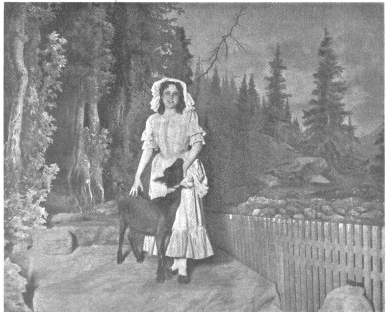
Die Sörster-Christel. — Zur Erinnerung an die Aufführung am Berner Stadttheater.

In St. Gallen starb 72-jährig alt Nationalrat Theophil Bühler, nachmaliger Direktionssekretär der Bundesbahnen in St. Gallen.