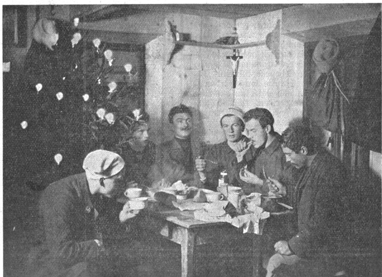
Weihnachten in der Klubhütte.

Der Regierungsrat hat die Volksabstimmung über die Abänderung von Art. 9 der Staatsverfassung (Großratswahlverfahren) und das Brandversicherungsgesetz auf den 1. März 1914 angeordnet.