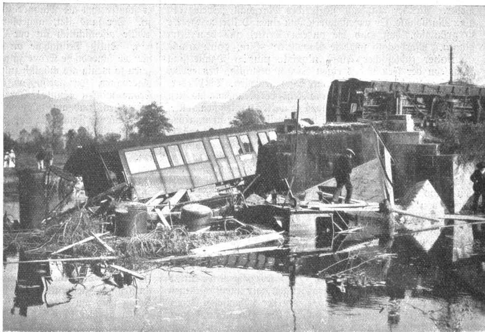
Das Eisenbahnunglück bei Reazzino an der Linie Bellinzona-Locarno. (Text f. „Wochenschronik“.)

im Süden von Dresden, es war die böhmische Armee unter Schwarzenberg, einem klugen Mann, aber keinem großen Feld-