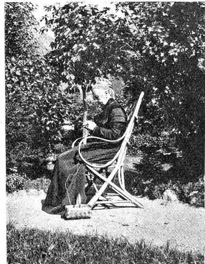
Die Mutter des Dichters.

Anno 1893 erschien mein erstes Buch, eben diese „Kämpfe“. Es brachte mir kein Honorar; der Wunsch, ein Buch meinen Namen tragen zu sehen, ließ mich vergessen, daß es Dinge wie Verlagsverträge gibt; die Kritik hat ja auch das Buch nach Gebühr und sicherlich mit Recht zerzaust. Aber ich durfte dieses mein erstes Buch meiner lieben kleinen Braut als Hoch-