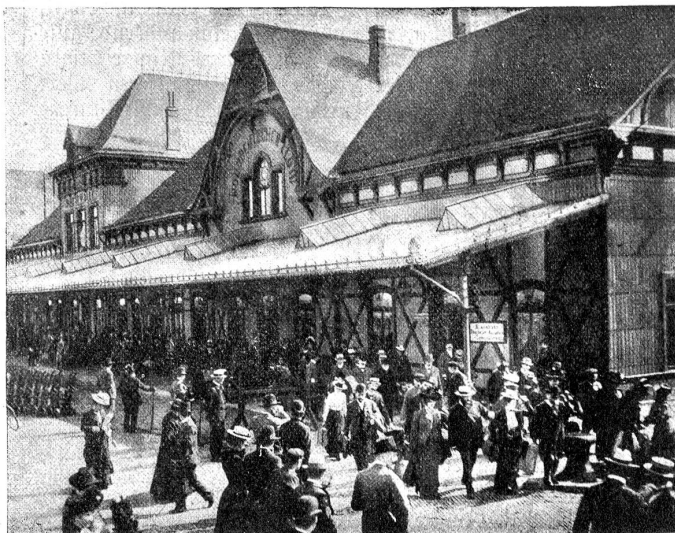
Einstieghalle des Norddeutschen Lloyd in Bremerhaven.

Es war vor hundert Jahren noch wenig verlockend, die 10 bis 20 Wochen dauernde Reise zu unternehmen. Aus einem Bericht aus dem 18. Jahrhundert vernehmen wir, daß die Reise von Bern bis Rotterdam zu Schiff auf der Aare und dem Rhein 53 Tage in Anspruch nahm und daß unterwegs sechs Personen starben. Im Jahre 1819 reiste eine Gesellschaft von 2000 Schweizern nach Rio de Janeiro; die Ueberfahrt von Rotterdam und Amsterdam aus erfolgte in zwei bis vier Monaten, während die ganze Reise vier bis sieben Monate (je nach der Gelegenheit zur Einschiffung) dauerte. 316 Personen, d. i. mehr als 15%, starben während der Ueberfahrt; auf einem Schiffe, auf dem der Typhus ausgebrochen war, sogar 109 Personen oder ein Viertel der Reisenden. Aus dem Jahre 1735 vernehmen wir, daß die Seereise 30 Kronen kostete; der Berichterstatter im „Abisblättlein“ fand diesen Betrag gering, glaubte aber, daß der Unternehmer dennoch auf seine Rechnung kommen würde, da „die meisten in der Zeit werden nach der Ewigkeit gesäglet sein.“