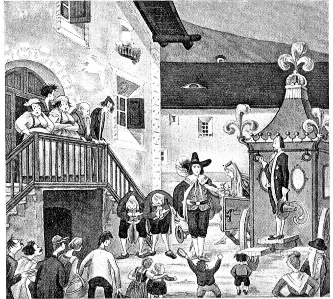
Eine prächtige Staatskarosse fuhr vor das Haus des Vaters.

Andreas stuzte wohl einen Augenblick, denn es war wahrhaftig keine Kleinigkeit, das gewaltige Tier siebenmal durch das ganze Haus zu schleppen — aber er machte sich doch an die Arbeit. Er zog und zog und mitunter schien es ihm unmöglich zu Ende zu kommen, aber er dachte daran, wieviel Gutes ihm das Tier schon getan und faßte immer wieder neuen Mut. So gelang ihm auch die schwerste Probe und nach einigen Stunden harter Mühe war die Arbeit getan. Als Andreas nun schwer atmend da stand und sich den Schweif von der Stirne wischte, gab es plötzlich einen furchtbaren Krach, als stürze der ganze Palast zusammen. Im gleichen Augenblick aber stand eine herrliche Jungfrau vor ihm, die ihm mit Tränen in den Augen für ihre Befreiung dankte. Sie trug eine Krone im goldblonden Haar und war so schön, wie Andreas noch nie eine Frau gesehen hatte. Mit lieblichem Lächeln faßte sie ihn bei der Hand und zeigte ihm nochmals alle Schätze ihres Palastes. Dann machten sie sich miteinander auf den Weg.