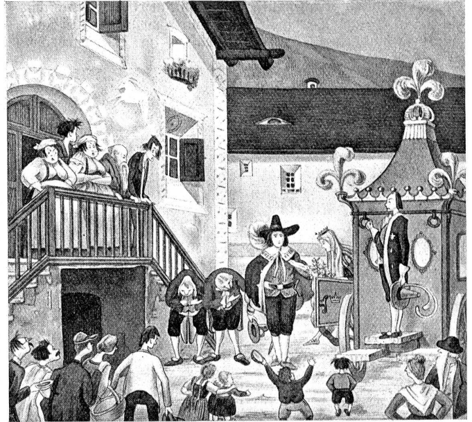
Eine prächtige Staatskarosse fuhr vor das Haus des Vaters.

Andreas stuzte wohl einen Augenblick, denn es war wahrhaftig keine Kleinigkeit, das gewaltige Tier siebenmal durch das ganze Haus zu schleppen — aber er machte sich doch an die Arbeit. Er zog und zog und mitunter schien es ihm unmöglich zu Ende zu kommen, aber er dachte daran, wieviel Gutes ihm das Tier schon getan und faßte immer wieder neuen Mut. So gelang ihm auch die schwerste Probe und nach einigen Stunden harter Mühe war die Arbeit getan. Als Andreas nun schwer atmend da stand und sich den Schweif von der Stirne wischte, gab es plötzlich einen furchtbaren Krach, als stürze der ganze Palast zusammen. Im gleichen Augenblick aber stand eine herrliche Jungfrau vor ihm, die ihm mit Tränen in den Augen für ihre Befreiung dankte. Sie trug eine Krone im goldblonden Haar und war so schön, wie Andreas noch nie eine Frau gesehen hatte. Mit lieblichem Lächeln faßte sie ihn bei der Hand und zeigte ihm nochmals alle Schätze ihres Palastes. Dann machten sie sich miteinander auf den Weg.