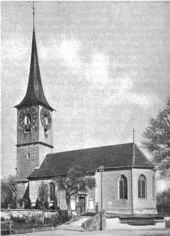
Die Kirche von Hindelbank vor dem Brande.

So besang der große Haller im Jahr 1751 das Grabmal Nahl's für die Frau Langhans, zu dem die Empfindsamen aller Stände vor 150 Jahren pilgerten und den Ruhm der Kirche weit herum verbreiteten. Vor etwa einem Menschenalter begann der Glanz des Grabmahls zu verblassen, die Gebildeten aber pilgerten wiederum nach Hindelbank, denn im Kirchenchor schimmerten prachtvolle Glasgemälde, vier ganze Fenster in der üppigen Pracht des beginnenden sechzehnten Jahrhunderts; als Hüterin dieses Schatzes wurde die Hindelbanker Kirche zum zweiten Mal weit herum bekannt.