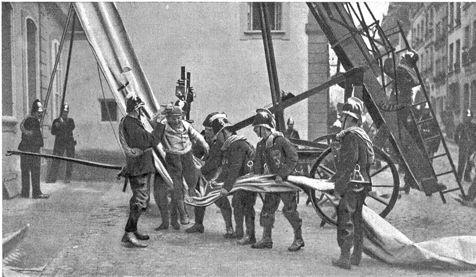
Eine Übung mit der mechanischen Leiter und dem Rutschtuch.

Die erste Nürnberger-spritze wurde 1617 vom Berner Rat erstanden. 1665 hatte die Stadt schon 6 Spritzen, denen sie liebevolle Namen verlieh: Bär, Hirz, Löwe, Gryff (Adler), Schwan, Steinbock. Auch mit der Einführung von Neuerungen und Verbesserungen war Bern immer voran. So war es wohl die erste Schweizerstadt, die sich (1699) in Besitz der nach dem Erfinder