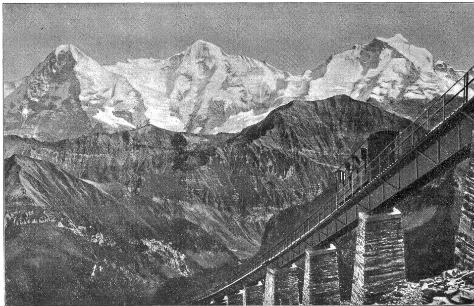
Niesen-Bahn. Hegernalp-Viadukt, 66% Steigung. — Eiger, Mönch und Jungfrau.

Die Talstation der Niesenbahn befindet sich in Mülenen an der Rander, 693 m ü. M., in unmittelbarer Nähe der Station Mülenen-Meschi des elektrisch betriebenen Teilstückes Spiez-Fru-