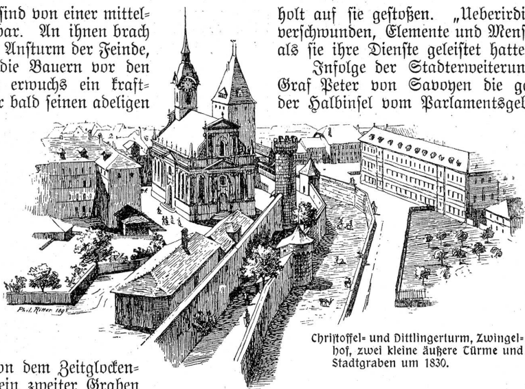
Christoffel- und Dittlingerturm, Zwingelhof, zwei kleine äußere Türme und Stadtgraben um 1830.

Infolge der Stadterweiterung des Jahres 1255 hatte Graf Peter von Savoyen die ganze Westfront, die Breite der Halbinsel vom Parlamentsgebäude bis zum Waisenhaus hinunter zu befestigen und auch die neue Brücke über die Aare drunten bei der Nydegg bedurfte eines festen Stützpunktes auf dem feindlichen rechten Ufer. Diese zweite Stadtbefestigung bestand oben aus dem Käfigturm als Mittelpunkt und Haupteingang, dem Juden-, dem Prediger- und dem Marziliturm als weiten Toren, hinter dem tiefen Graben an Stelle des Bären- und des Waisenhaus-