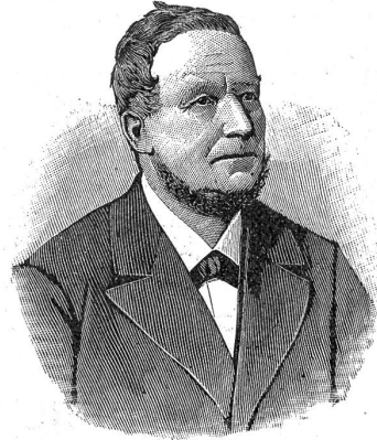
† Regierungsrat Niklaus Rätz.

bahnschienen, für Lokomobile, für landwirtschaftliche Maschinen u. s. w. Es ist ein weiter Weg vom Bauernbuben, der mit andern Kindern in den Spänen und zwischen den Brettern der Säge seines früh verstorbenen Vaters und Dufels ohne Schuhe und Strümpfe herumsprang, bis zu dem industriellen Geschäftsherrn, der in Verbindung mit zahlreichen in-