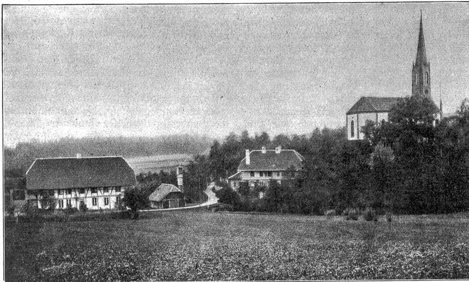
Kirche und Schulhaus in Rapperswil.

Ein tüchtiger Verwaltungsbeamter sodann war Niklaus Käz, den die Verhältnisse aus der einfachen Bauernstube in das bernische Regierungsgebäude versetzten. Dem Cicinnatus