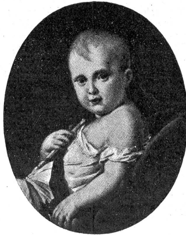
Der König von Rom.

ammann und den Mitgliedern der Eidgenössischen Tagsatzung! Sehr liebe und große Freunde! Die Ueberzeugung von dem Interesse, das Sie an allem nehmen, was uns betrifft, erlaubt uns keinen Aufschub, Sie zu benachrichtigen, daß die Kaiserin, unsere sehr teure, vielgeliebte Gattin und Gefährtin sehr glücklich von einem Prinzen entbunden worden ist, der durch seine Geburt den Titel eines „Königs von Rom“ erhalten hat. Durch Ihre Teilnahme an der Zufriedenheit, welche Wir bei diesem für unsere kaiserliche Familie und für das Glück der Völker, welche die Vorsehung uns anvertraut, so höchst wichtigem Ereignis fühlen, werden Sie mir einen neuen Beweis der Gesinnung ablegen, die mir Ihrerseits schon so oft gezeigt worden ist. — Sie sollen an der fortdauernden Geneigtheit, Ihnen Beweise der Zuneigung zu geben, nicht zweifeln. Mit wahrem Vergnügen ergreifen Wir die Gelegenheit, Sie unserer vollkommenen Achtung und Wohlwogenheit zu versichern. Worauf wir Gott bitten, daß er Sie, sehr liebe und große Freunde, in seiner heiligen und gnädigen Obhut erhalte. Paris, den 20. März 1811. Ihr guter Freund Napoleon“.