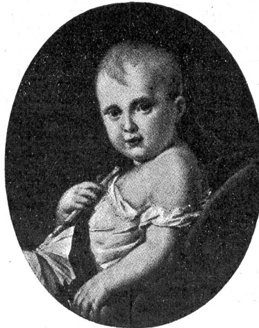
Der König von Rom.

ammann und den Mitgliedern der Eidgenössischen Tagsatzung! Sehr liebe und große Freunde! Die Ueberzeugung von dem Interesse, das Sie an allem nehmen, was uns betrifft, erlaubt uns keinen Aufschub, Sie zu benachrichtigen, daß die Kaiserin, unsere sehr teure, vielgeliebte Gattin und Gefährtin sehr glücklich von einem Prinzen entbunden worden ist, der durch seine Geburt den Titel eines „Königs von Rom“ erhalten hat. Durch Ihre Teilnahme an der Zufriedenheit, welche Wir bei diesem für unsere kaiserliche Familie und für das Glück der Völker, welche die Vorsehung uns anvertraut, so höchst wichtigem Ereignis fühlen, werden Sie mir einen neuen Beweis der Gesinnung ablegen, die mir Ihrerseits schon so oft gezeigt worden ist. — Sie sollen an der fortdauernden Geneigtheit, Ihnen Beweise der Zuneigung zu geben, nicht zweifeln. Mit wahrem Vergnügen ergreifen Wir die Gelegenheit, Sie unserer vollkommenen Achtung und Wohlwogenheit zu versichern. Worauf wir Gott bitten, daß er Sie, sehr liebe und große Freunde, in seiner heiligen und gnädigen Obhut erhalte. Paris, den 20. März 1811. Ihr guter Freund Napoleon“.