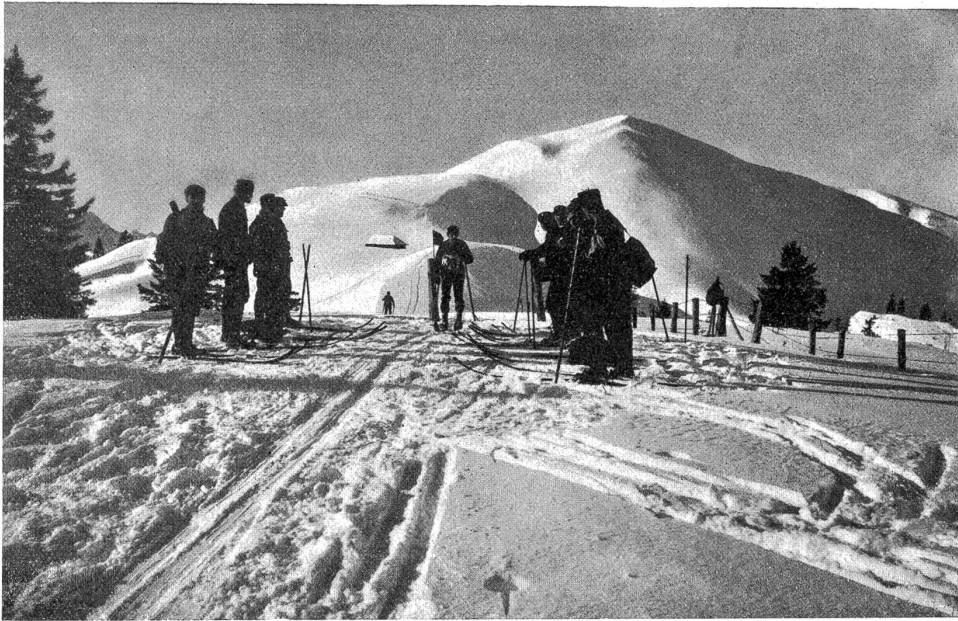
Skirennen Morgetengrat-Staffelalp. — Kontrollstation oberhalb der Stierenhütte.

auf dem Cimitero di San Lorenzo seine letzte Ruhestätte gefunden habe. Ganz sinnlosabwesend durchirrte ich die Straßen Roms und konnte noch immer nicht glauben, daß mein lieber, lebenslustiger Kamerad nicht mehr unter den Lebenden weilte.