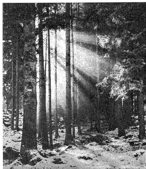
Wintermorgen im Bergwald.

blendenden Lichtteppich, in den die braunen Wälder wie Rauchtopase eingenäht sind. Die großen künstlichen Eisbahnen auf dem Boden der Mulde erscheinen wie Mattglascherben, auf denen die gewandtesten Schlittschuhläufer gleich winterträgen Fliegen herumkriechen.