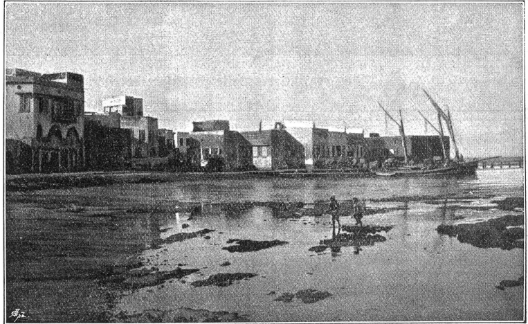
Der Hafen von Tripolis.

Lange bevor die europäischen Großstaaten ihre interessierten Blicke nach den nordafrikanischen Ländereien richteten, unterhielten die italienischen Städteterritorien am Mittelmeer, Genua, Pisa, daneben Venedig und Livorno, einen regen Handelsverkehr mit den Städten der nordafrikanischen Küste, ja sie hatten fast in allen größern Orten daselbst eigene Absteigequartiere, in manchen Niederlagen, ständige Vertreter und Konsule. Die mächtigen Korallenlager an der afrikanischen Küste veranlaßten italienische Fischer unaufhörlich, sich an diesen Gestaden unbemerkt einzunisten und die Korallenfischerei zu betreiben. Die italienischen Handelsrepubliken waren denn auch die ersten, welche zunächst mit den eingeseffenen Herrschern der nordafrikanischen Staaten und später mit den Türken Verträge als Schutzmittel gegen die Seeräuberei abschlossen. Nach ihnen erschienen die Portugiesen, dann die Spanier, Franzosen und Engländer, verdrängten die Italiener von ihren wirtschaftlichen Beziehungen zu den Städten Nordafrikas und teilten nach und nach das Land unter sich auf. Italien spielte so lange Zeit den Gutmütigen und hernach den Enttäuschten. Aber nachdem Frankreich und England durch Vertrag vom