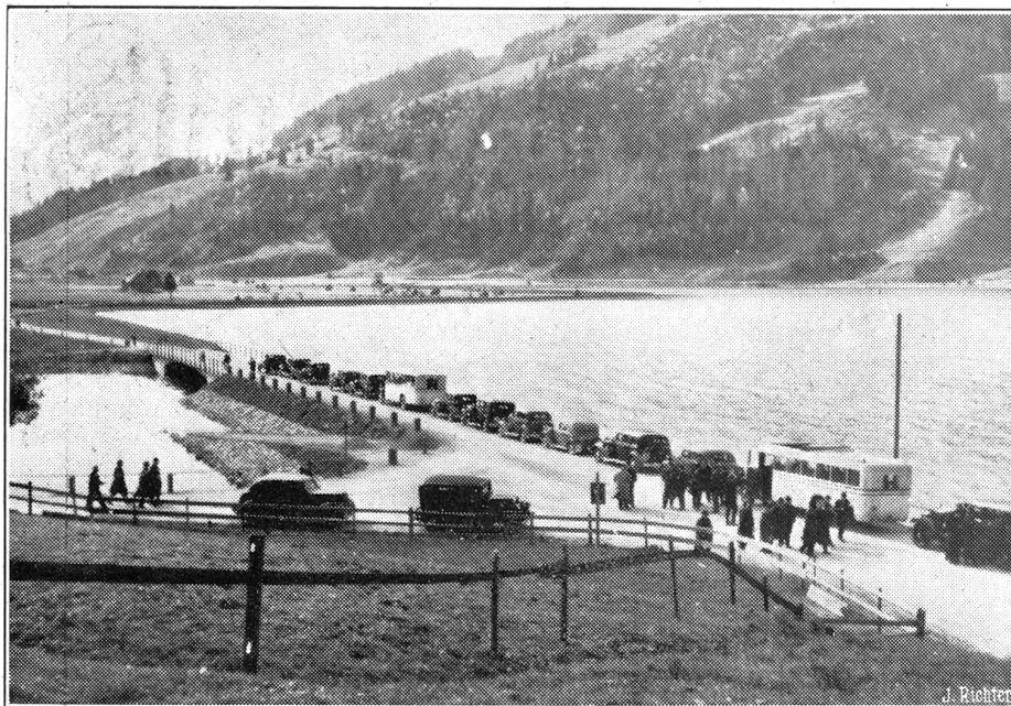
Eröffnungsfeier des Etzelwerkes.

Am Samstag nachmittag fand in Anwesenheit von Vertretern der Nordostschweizerischen Kraftwerke, der S. B. B., Behörden, Presse usw. die offizielle Eröffnungsfeier der Etzelwerkbauten statt. Die Wagenkolonne mit den Teilnehmern an der Eröffnungsfeier beim sog. Höhport, wo die Sihl sich in den Sihlsee ergiesst.