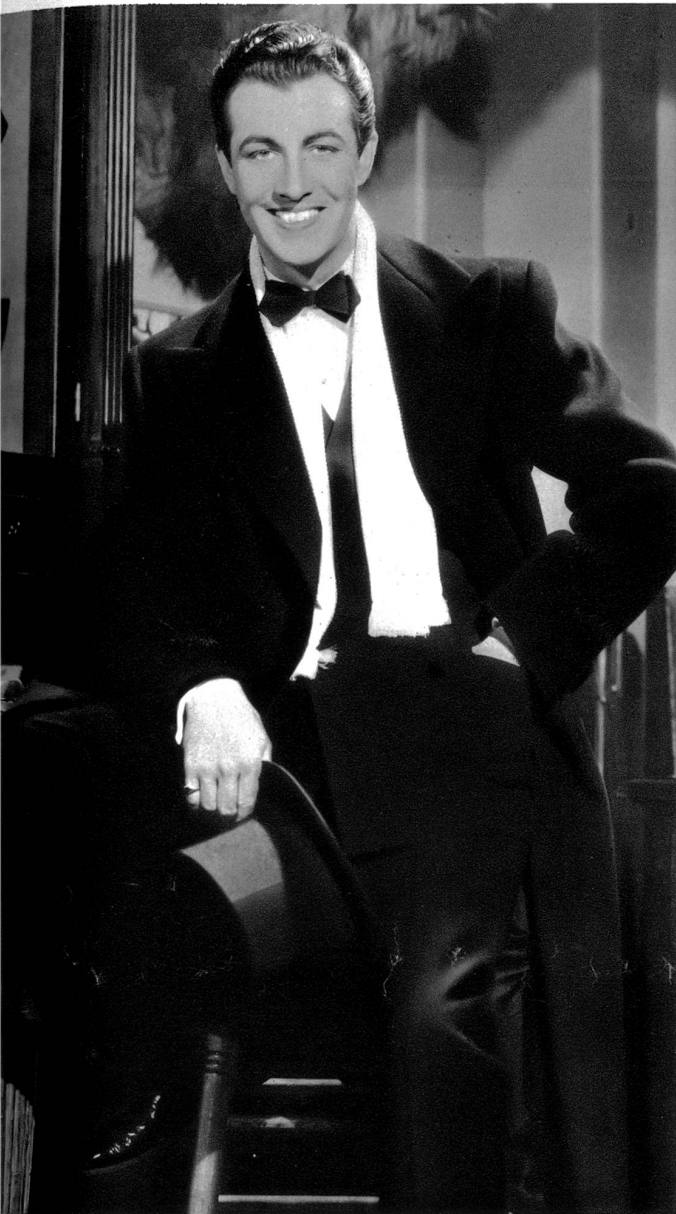
Robert Taylor . . . der neueste Weltstar! Ueber Nacht berühmt geworden, ist er heute der Liebling aller Frauen und wird in der kommenden Saison in verschiedenen Metro-Goldwyn-Mayer Filmen auftreten.

sagte, hat sich inzwischen erfüllt; und zumal für eine in früherer Zeit als hoffnungslos geltende Erkrankung des Zentralnervensystems: das Lähmungsirresein oder die Paralyse, fälschlich auch „Gehirnerweichung“ genannt, hat die moderne Medizin auf diese Weise ein wirksames neues Behandlungsverfahren geschaffen. Schon im Laufe des vorigen Jahrhunderts war es aufgefallen, daß gewisse Formen von Geistesverwirrung und Irresein eine bedeutende Besserung erfuhren, wenn etwa die Kranken irgend einen Zufall von einer mit hohem Fieber einhergehenden Ansteckungskrankheit befallen wurden. Bereits 1848 erschien ein derartiger Bericht in Bonn und 1864 ein ähnlicher in Rostock; aber erst der neueren Zeit blieb es vorbehalten, aus diesen Zufallserfahrungen planmäßig ein klinisch brauchbares Behandlungsverfahren der furchtbaren Paralyse abzuleiten. Der Wiener Psychiater Julius Wagner-Jauregg war es, der zum ersten Male den Schritt von der Theorie zur Praxis wagte und Kranke, die an der Paralyse litten, bewußt mit fiebererzeugenden Mitteln behandelte.