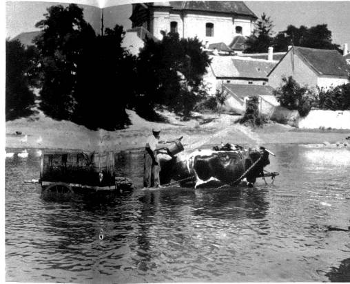
Dorfteich in der Slowakei