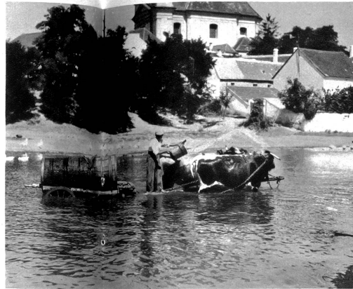
Dorfteich in der Slowakei