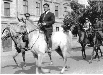
Geleite durch tschechoslowakische Offiziere

Der Schimmel von Perbal, das neuerworbene ungarische Halbblut, wird von den Zämbeker Schwaben getauft. Er erhält den Namen „Kedves“ — Liebling. Auf dem Bilde ungar-schwäbische Mädchen in der Tracht