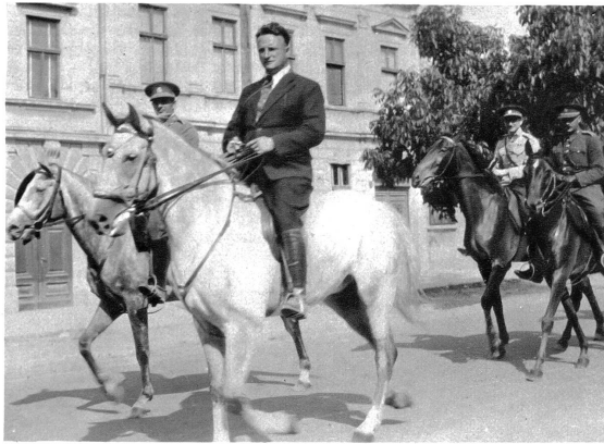
Geleite durch tschechoslowakische Offiziere

Der Schimmel von Perbal, das neuerworbene ungarische Halbblut, wird von den Zsambéker Schwaben getauft. Er erhält den Namen „Kedves“ — Liebling. Auf dem Bilde ungar-schwäbische Mädchen in der Tracht