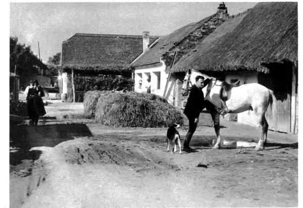
Abmarsch am frühen Morgen