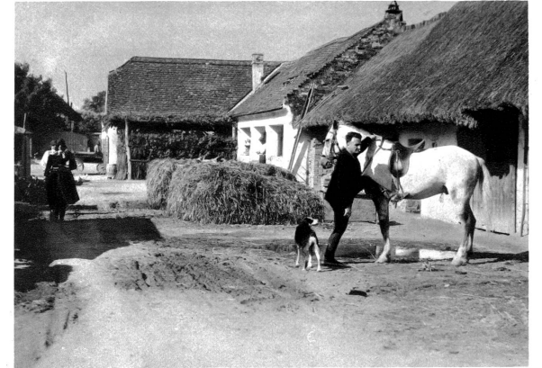
Abmarsch am frühen Morgen