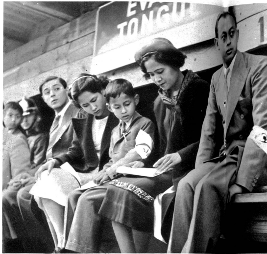
Verwandte und Bekannte vom siamesischen Rennfahrer Prinz Bira verfolgen die Zeiten der Rennfahrer