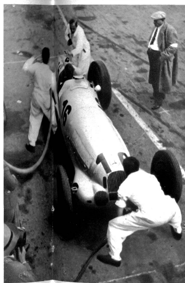
Auf die Sekunde kommt es an. Tanken, Hinterräder wechseln und dem Fahrer den Durst löschen, alles insgesamt in 30 Sekunden