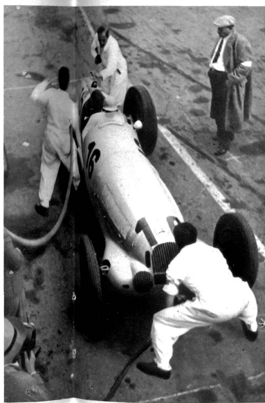
Auf die Sekunde kommt es an. Tanken, Hinterräder wechseln und dem Fahrer den Durst löschen, alles insgesamt in 30 Sekunden