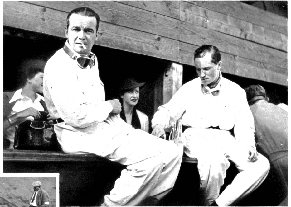
Zwei grosse Favoriten des Mercedes-Rennstalles. Links Rudolf Caracciola, der bereits 1935 das Rennen gewann. Rechts Manfred von Brauchitsch, der diesjährige Sieger vom grossen Preis von Monaco