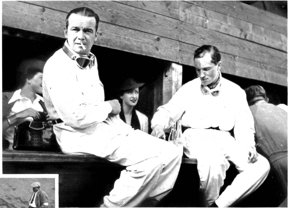
Zwei grosse Favoriten des Mercedes-Rennstalles. Links Rudolf Caracciola, der bereits 1935 das Rennen gewann. Rechts Manfred von Brauchitsch, der diesjährige Sieger vom grossen Preis von Monaco