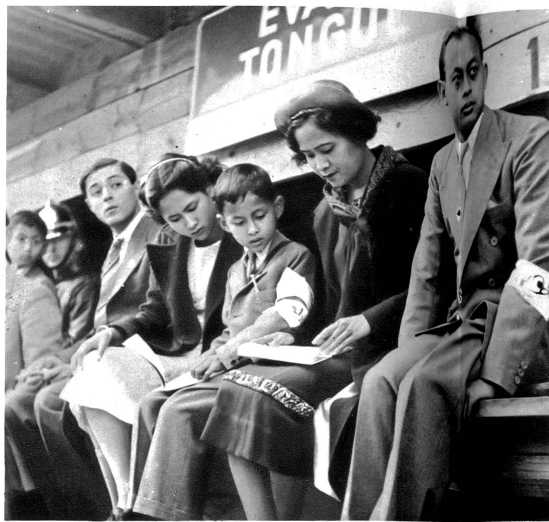
Verwandte und Bekannte vom siamesischen Rennfahrer Prinz Bira verfolgen die Zeiten der Rennfahrer