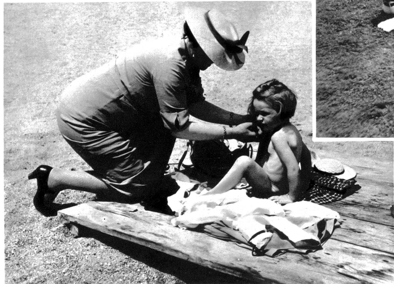
Nun heisst es noch das Haar zurechtmachen