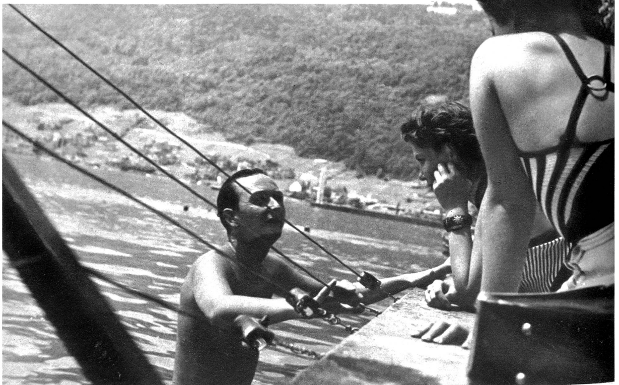
Ein kleiner Flirt mit so hübschen Strandnixen ist ganz selbst- verständlich