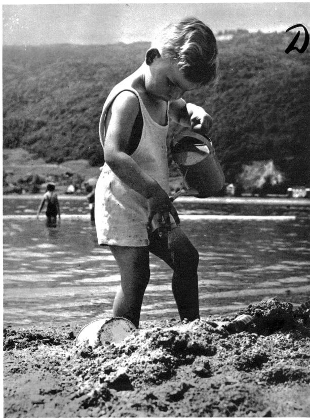
Der kleine Strandbaumeister nimmt die Sache ernst