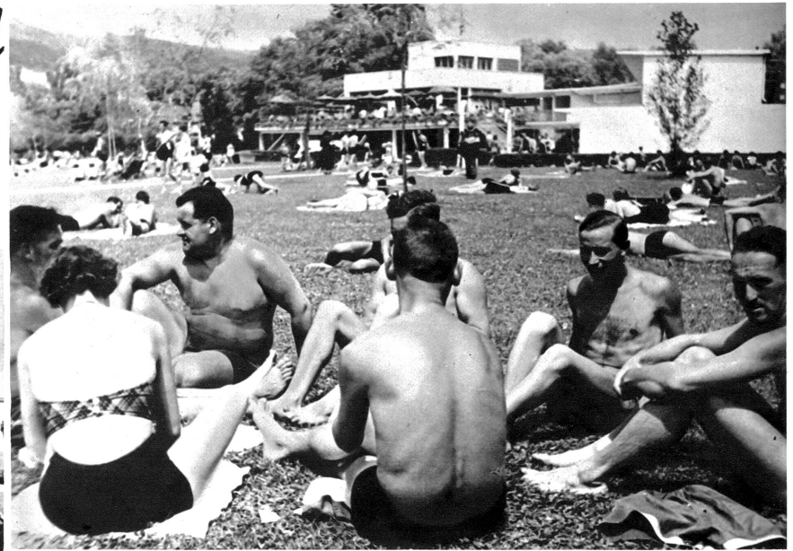
Im gemütlichen Freundeskreise lässt sich gut diskutieren