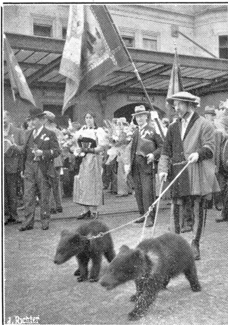
Das Eidg. Schwing- und Aelplerfest in Lausanne.

Links: Die Berner als Veranstalter des letzten Eidg. Schwing- und Aelplerfestes, brachten in einem schmucken Festzug die Zentralfahne nach Lausanne. Zwei junge Bären aus dem Berner Bärengraben wurden ebenfalls im Festzug mitgeführt.