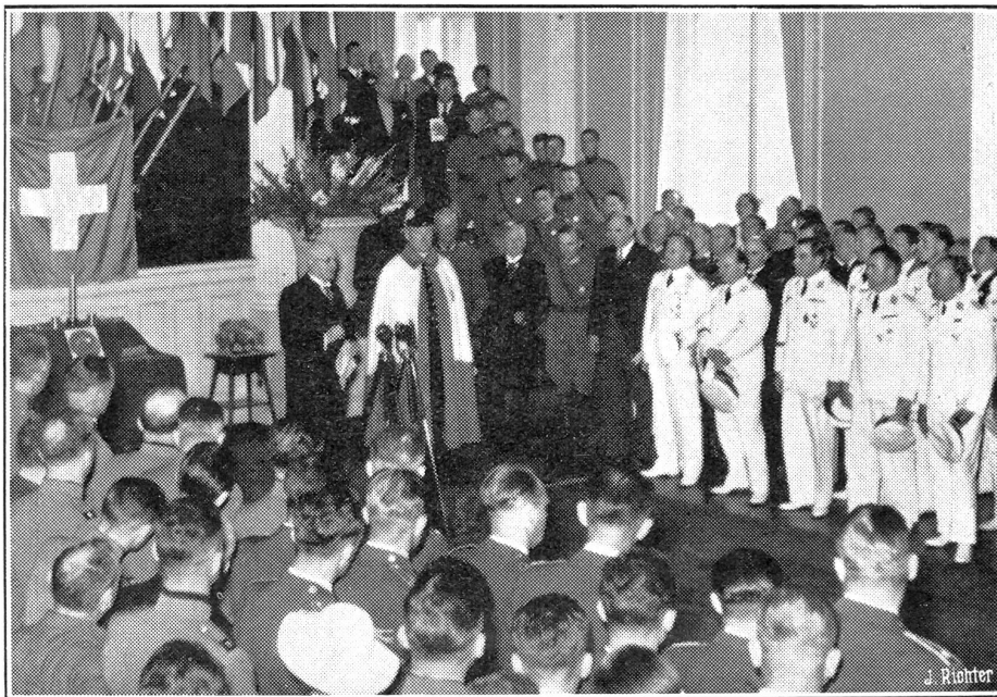
Das internationale Flugmeeting in Zürich.

Das Eidgenössische Volkswirtschaftsdepartement teilt mit, daß die Anpassung der Inlandverkaufspreise für Benzin infolge der steigenden Weltmarktpreise unvermeidlich war. Der Detailverkaufspreis wird deshalb ab Säule von 43 auf 45 Rappen pro Liter erhöht, und auch die übrigen Ansätze wer-