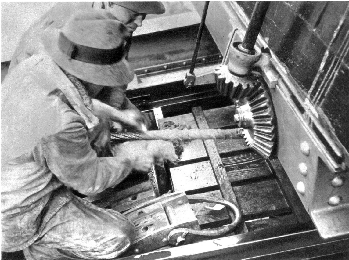
Das Seil wird im Wagen fest eingeklammert

bahnen anvertrauen. Betroßt! Da dürfen Sie immer fahren, denn es wird in der Schweiz das Meuerste getan, um sicher und schnell fahren zu können, und gerade bei den Bergbahnen ist die Kontrolle eine große und ausgedehnte. So werden einmal die Seile bei den Drahtseilbahnen einer sehr genauen Prüfung unterzogen und mehr noch — müssen oft ausgewechselt