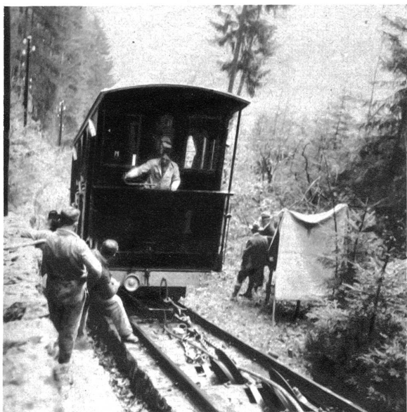
Jeden Haltes bar saust der Wagen in die Tiefe; aber grossartige Bremsvorrichtungen verhindern einen langen Lauf. Nach vierzig bis sechzig Centimeter stoppt der schwer belastete Wagen