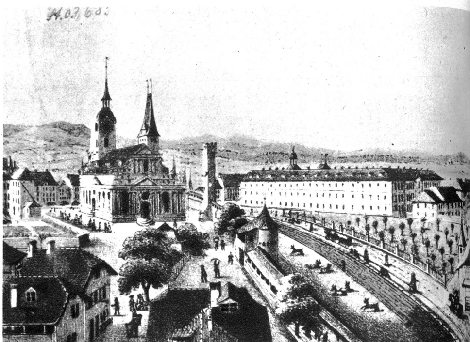
Zwingelhof, ein Teil der Festungsmauern. Der hohe Turm mit den Zinnen ist der Dittlingerturm, einstmals der Folterturm

Der Christoffelturm, unstreitig eines der imposantesten Bauwerke der Stadt Bern, besaß für Fußgänger und Fuhrwerke einen einzigen Durchgang, bis im Jahr 1814 dazu noch ein großer und kleiner Durchgang geschaffen wurde. 1830 wurden auf beiden Seiten Durchgänge gemacht. Immer mehr aber wurde der Turm als Verkehrshindernis empfunden. Der schon lange