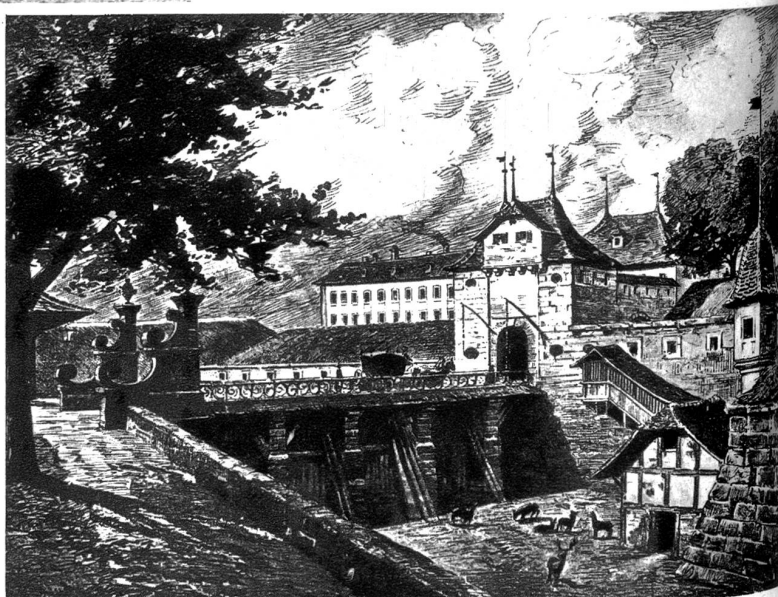
Murtentor, äussere Ansicht

Mit dem Christoffelturm wurde auch der Davidsbrunnen, wohl einer der beliebtesten Brunnen der Stadt Bern entfernt. Auf seiner Säule trug er die Statue des schleudertragenden David, ein Werk des Bildhauers Rahm. Die künstlerisch bedeutende Figur wurde von privater Hand erworben