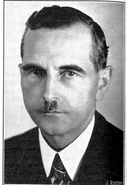
Der neue Berner Stadtpräsident.