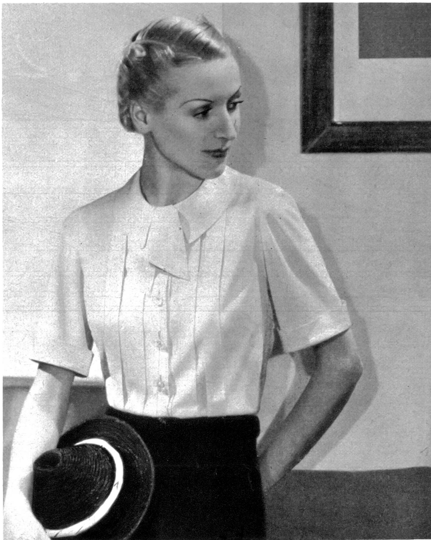
Nr. 1 Kleidsame Bluse, aus weisser Waschseide; Stoffbedarf bei 0.80 cm Breite 2.20 m, bei 1 m Breite 1.70 m Zuschneiden und Heften Fr. 2.80

Die Rücksendung erfolgt prompt unter Nachnahme für das Zuschneiden.