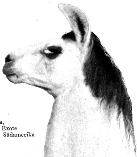
Lama, ein Exote aus Südamerika