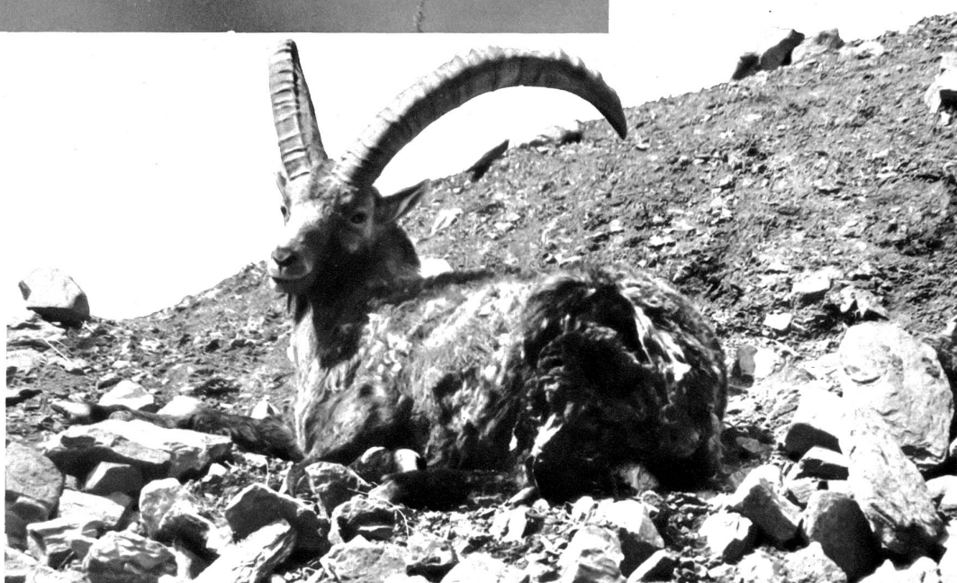
Aus der Steinbockkolonie