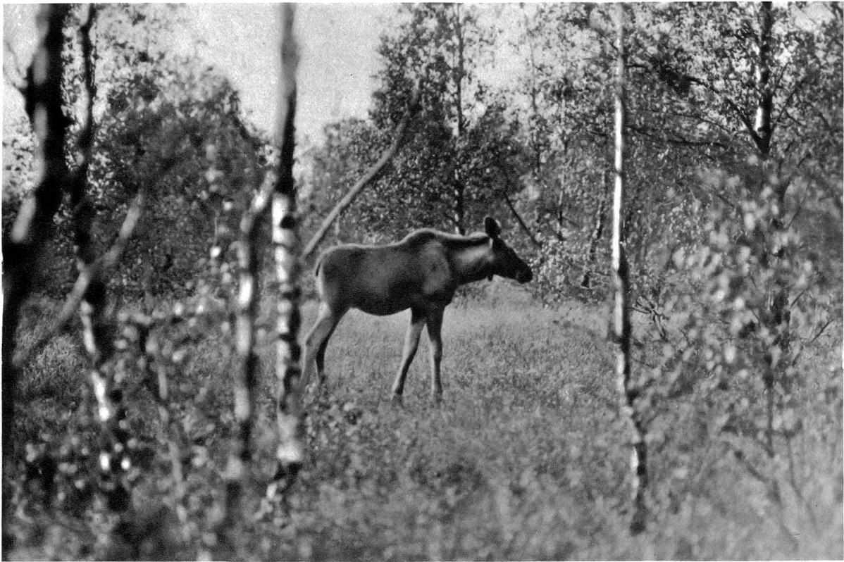
Elch im Revier