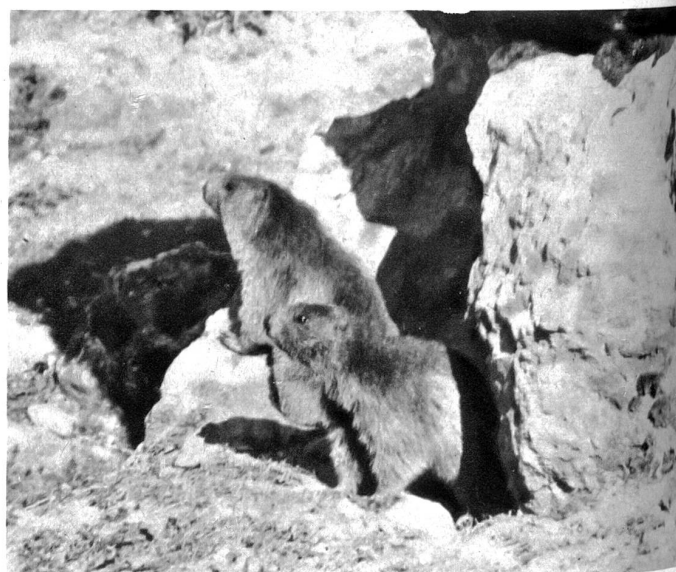
Murmeltiere vor ihrem Bau