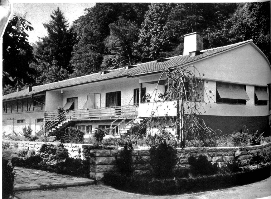
Verwaltungsgebäude des Tierparks

betrieben, ergänzt, erweitert werden. Daraus erwachsen dem Vereine neue Aufgaben, die an Wichtigkeit den bisherigen nicht nachstehen. Dies war die einhellige Ueberzeugung der in den letzten Tagen abgehaltenen zahlreich besuchten Mitgliederversammlung, welche einstimmig die Statuten dem neuen Ziele, Förderung des Tierparkes, anpaßte. Der Dählhölzli-Tierpark ist nicht ein reiner Naturpark. Die prächtigen gärtnerischen Anlagen lassen dies augenfällig erkennen. Der Natur- und Tierpark hat sich daher die Bezeichnung „Tierparkverein Bern“ gegeben. Als solcher wird er seine ganze Kraft einsetzen, um die Gemeinde ideell und materiell in der Förderung des Tierparkes