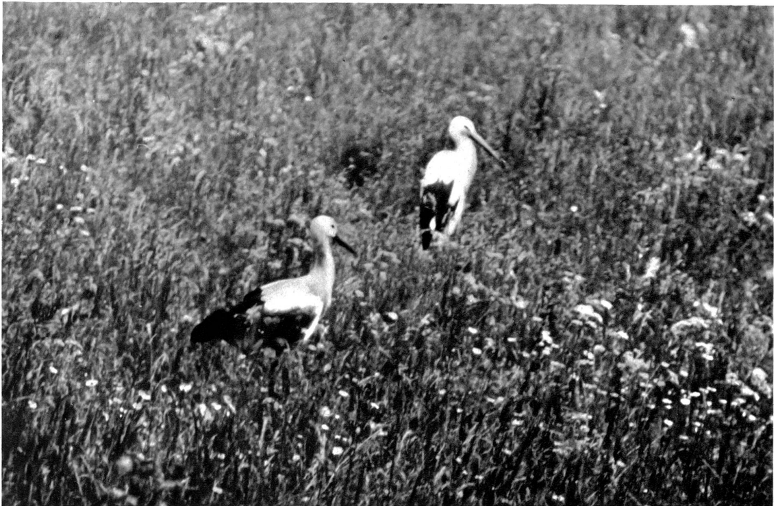
In der Storchenviese