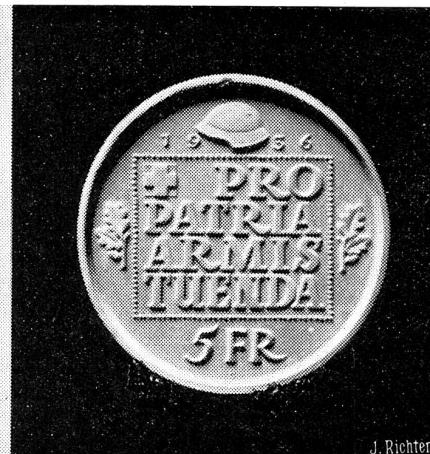
Der neue Wehranleihe-Fünfliber.

Das Preisgericht für den neuen Wehranleihe-Fünfliber, den die eidgenössische Münzstätte zur Erinnerung an die Opferbereitschaft des Schweizervolkes für den modernen Ausbau der Schweizer Armee herausgeben wird, hat die vorgelegten Arbeiten namhafter Künstler geprüft und den 1. Preis dem Genfer Künstler Max Weber zugesprochen. Dieser Entwurf wird zur Ausführung gelangen. Unser Bild zeigt die Vor- und Rückseite des mit dem 1. Preis ausgezeichneten Entwurfes.