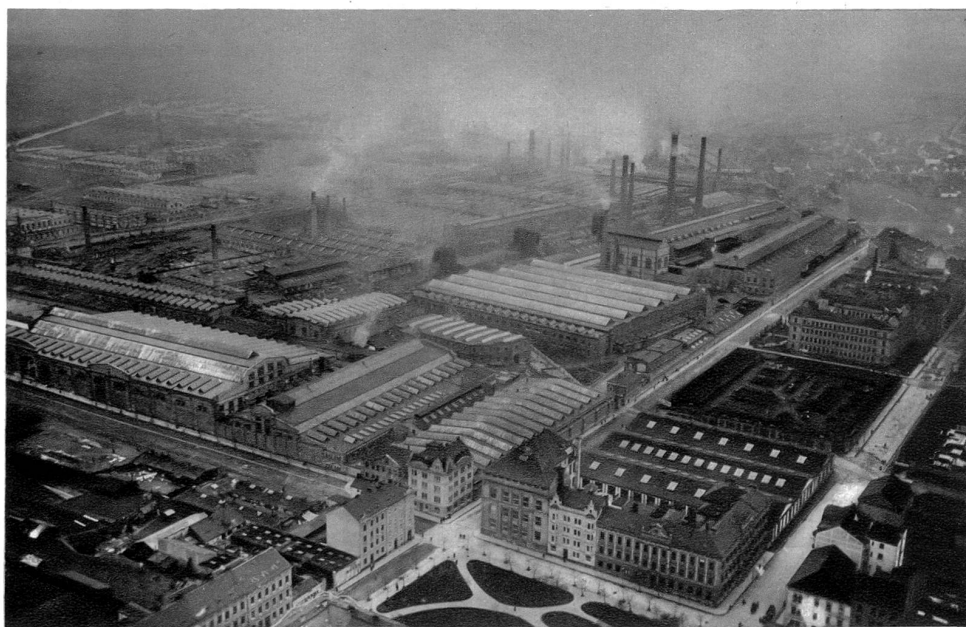
Skodawerke vom Flugzeug aus gesehen

der Republik herum zeigt heute noch den gleichen Grundriß wie zur Gründungszeit. Ein immerhin auch nicht allzuhäufiger Fall.