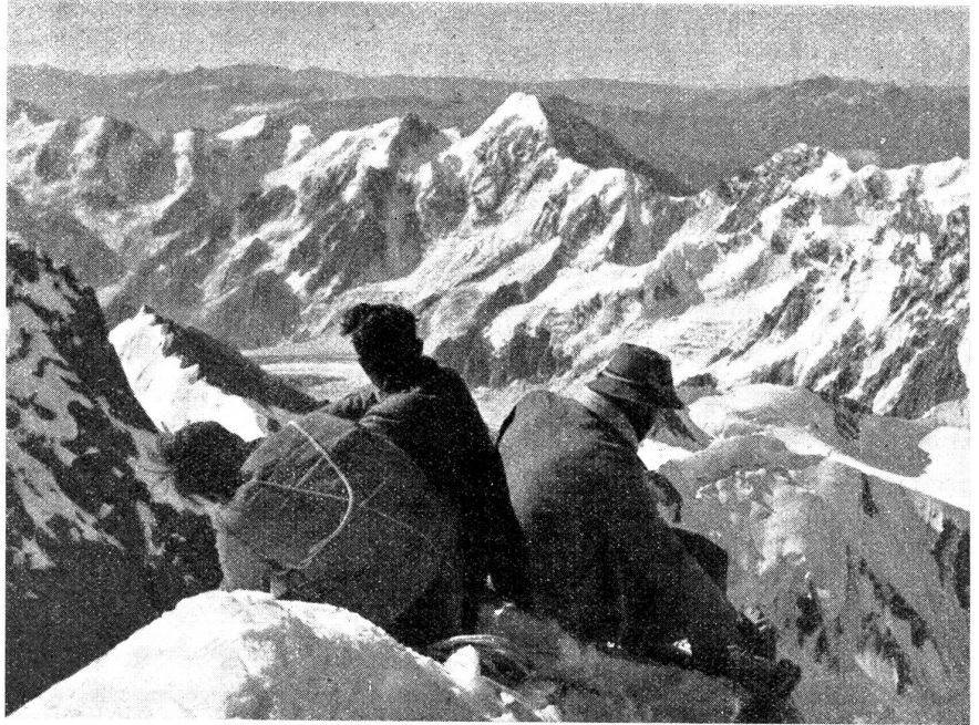
Sonnige Gipfelrast auf dem Düchtau (5198 Meter), dem zweithöchsten Berg des Kaukasus.

salem verblieb in fremder Hand. Kaiser, Könige, Prinzen und Ritter hatten ihren ganzen Einfluß und Reichtum, ihre ganze Tapferkeit und Erfahrung für die gemeinsame Sache eingesetzt und waren mit demütigenden Verlusten geschlagen worden. Ein Kaiser hatte auf den Kreuzzügen sein Leben verloren, und der tapferste der englischen Könige war gefangen genommen und nur unter Schwierigkeiten wieder losgekauft worden. Die Aussichten schienen hoffnungslos zu sein. Den christlichen Völkern mit all ihrer Macht und Hingabe war es nicht gelungen, in den Besitz des Heiligen Grabes zu gelangen.