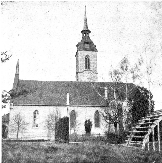
Kirche von Kirchberg.

neral hat den Ring bekommen, und das ist das Verdienst der Jungfer.“