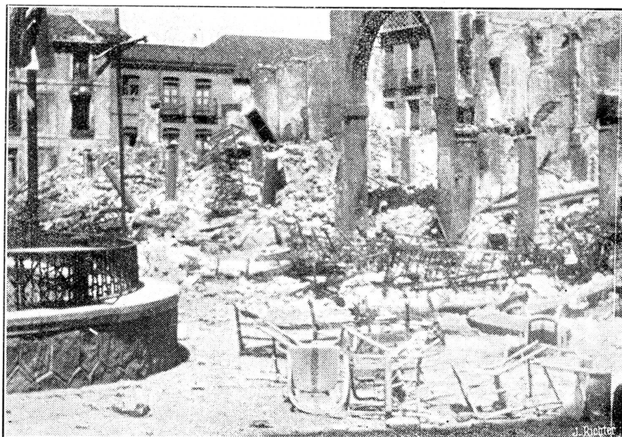
Das Trümmerfeld des Alcazar nach der letzten Bombardierung.

Um die nachträglichen Spekulationsmanöver und die Panik der kleinen „vernunftlosen Sparer“ zu verhindern, wurden die Börsen bis Dienstag geschlossen; ein Sturm auf die Banken dürfte keine zu schlimmen Folgen mehr haben. Sonntags ist Ruhe, bis Montag kann man sich folglich etwas beruhigen, und am Dienstag wird alles vor-bei sein. Es ist doch gut, gibt es noch Sonntage! So kal-tulierte die Regierung. Nachgerade haben die Mächtigen dieser Welt Erfahrung bekommen und wissen genau, wel-chen Verlauf eine derartige Sache nehmen wird. Aus bri-tischen Kommentaren läßt sich das deutlich erkennen: Das französische Fluchtkapital wird London verlassen und wie-der nach Paris ziehen. (So wanderten die Millionen ja auch wieder nach Brüssel zurück). Die französischen Staats-