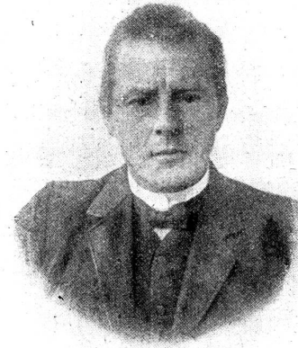
Heinrich Federer. † 29. April 1928.

Zu Zeiten, da die Krankheit einige Jugendsprünge er-laubte, war es des Knaben Liebstes, in das Schilf des Garnersees zu liegen und einigen Kameraden Geschichten zu