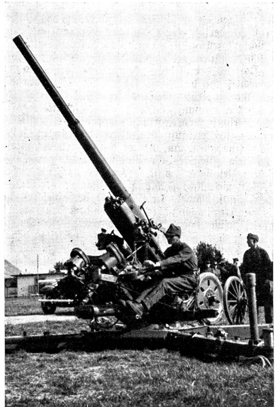
7,5 cm Flak in Feuerstellung.

Zum Lachen dieses Theater! Endlich mußte der Vorhang doch wohl aufgehen? Bewahre, er ging noch lange nicht auf.