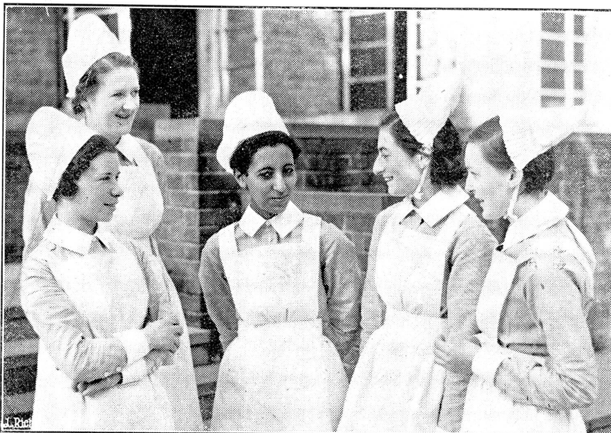
Die Tochter Hailé Selassie's als Krankenschwester.

Was hat denn die rote Regierung gegenwärtig für Probleme zu bewältigen, und warum greift sie auf die alten Revolutionäre, um Sündenböcke zu finden? Warum scheint ihr gerade ein Griff auf die ehemals führenden, neben Stalin einflußreichsten und bei Lebzeiten Lenins weit bedeutendern Bolschewisten am ungefährlichsten zu sein? Denn es ist klar, die Erschossenen und die Tausende von Verhafteten sind Sündenböcke. An die Verschwörung glauben in Europa und Amerika nur die ganz und gar der Phrase hörigen „reinlinigen“ Kommunisten, die gestern noch die Erschossenen zu den Heiligen ihrer Partei gezählt. Alle andern, die denken können, überlegen sich, daß Stalin mit irgendwelchen Widerständen zu ringen hat, von denen die Außenwelt nichts weiß, und daß er in eine unsichtbare Front von Gegnern vorgestoßen und ein paar Köpfe herausgegriffen, und zwar diejenigen, die mit ihrem Fall dem Regime am meisten dienen und am wenigsten schaden. Unter allen Vermutungen, die in den Zeitungen des Westens erhoben werden, kehrt die eine am häufigsten wieder: Die Generalität der Roten Armee ist im Spiel. Nur weiß niemand recht, inwiefern und mit welchen Zielen. Der Kommandeur des Fernen Ostens, Blücher, wird genannt und auch wohl mit Bonaparte verglichen, der einst der französischen Revolution den Garaus machte. Die hohen Offiziere, so viel kann man sich denken,