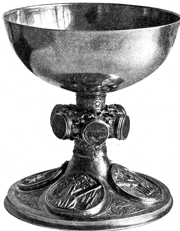
Zwinglibecher, den Zwingli verwendete, als er Geistlicher in Glarus war.

Erwähnen wir noch einen Metalleuchter flämischer Arbeit aus der zweiten Hälfte des 15. Jahrhunderts, der gleichfalls der Burgunderbeute zugeschrieben wird.