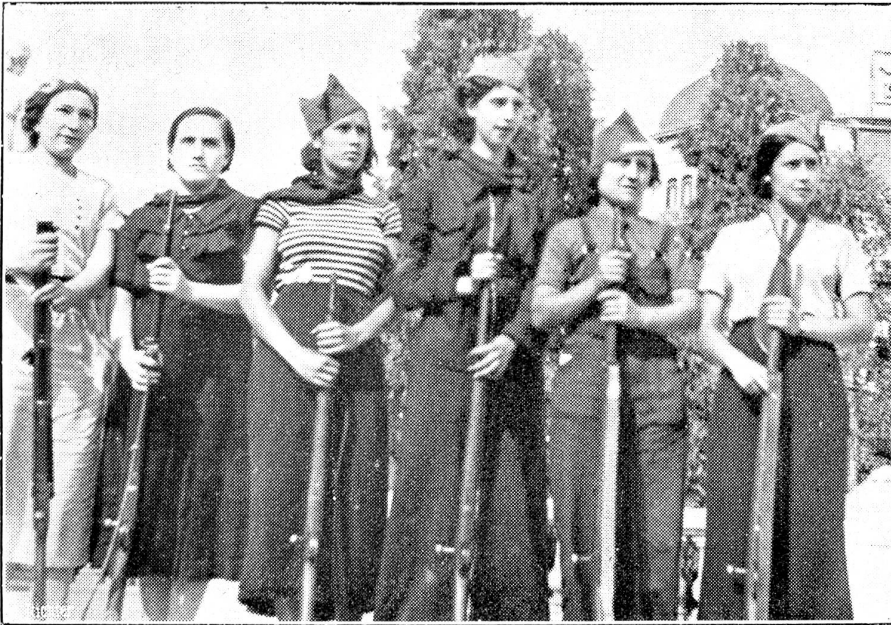
Zum Bürgerkrieg in Spanien. Eine Gruppe von Arbeitermädchen als Mitglieder der Arbeitermiliz.

Die Russen haben momentan der deutschen Propaganda wenig entgegenzusetzen. Sie wissen nur, daß Berlin alles tut, um die spanische Affäre auszunützen — gegen die Stellung Rußlands. Also ist es logisch, Spanien zu stützen. Die russischen Gewerkschaften haben der Volksfrontregierung in Madrid viele Millionen überwiesen, und der Sender in Moskau verbreitet jeden Abend Nachrichten über die deutschen Flugzeuge und die deutschen Waffen in Spanien. Also: Russisch-spanische Verschwörung! Geschickt richtet Berlin zu gleicher Zeit eine Protestnote gegen Moskau und gegen Madrid: Verlangt wird, daß die Sender in beiden Städten die Hege gegen das Dritte Reich und Hitler einstellen. Geschickt: Von nun an wird man Moskau und Madrid zusammenzählen. Und vergessen wird man, zu fragen, was eigentlich die beiden Sender gegen das Dritte Reich gesprochen. Und weiter wird man darüber vergessen, daß die deutschen Sender der Ansicht sind, in Spanien regiere die Mordkommune, und daß sie die Rebellen von Anfang an mit „Nationalisten“ angesprochen.