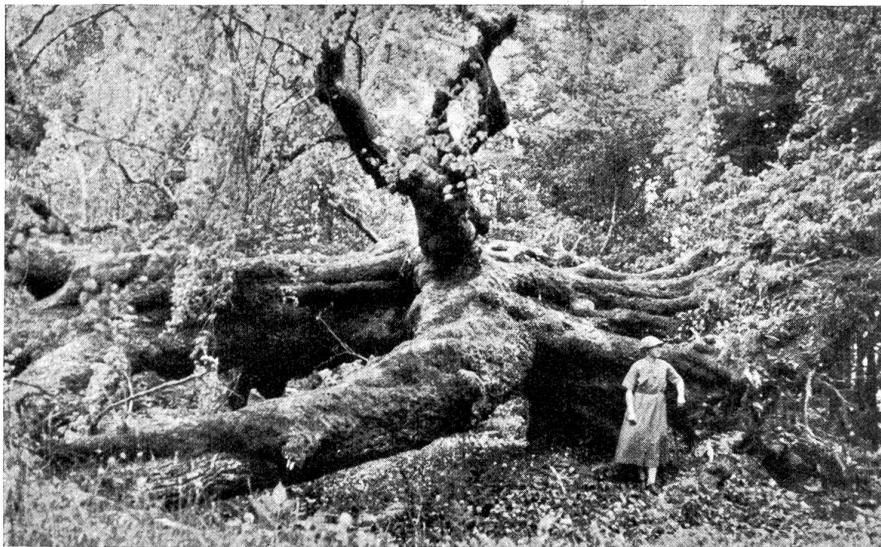
Die sterbende Linde im „Lindenmätteli“ ob Attiswil. Sie ist einem der letzten Frühlingsstürme erlegen. Ihr Stammumfang beträgt über 8 Meter und ihr Alter wird auf 1000 Jahre geschätzt.