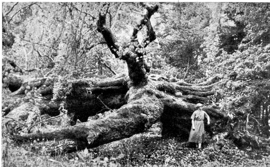
Die sterbende Linde im „Lindenmätteli“ ob Attiswil. Sie ist einem der letzten Frühlingsstürme erlegen. Ihr Stammumfang beträgt über 8 Meter und ihr Alter wird auf 1000 Jahre geschätzt.