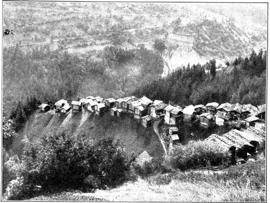
Pinsec, ein Dorf im Val d'Anniviers, auf schmaler Krette zwischen zwei Wildbächen gelegen.

Am folgenden Tage besuche ich mir die Dörfer Manoux und Pinsec. Im ersteren sind nur noch zwei Familien zu treffen und in Pinsec packen eben einige Familien ihre sieben Sachen. Alles geht so selbstverständlich, jedes Familienglied weiß, was es zu tun hat. Der älteste Sohn schleppt große