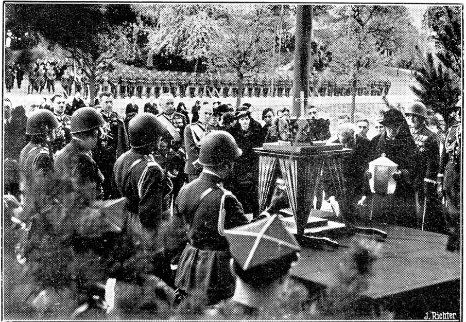
Das Herz Pilsudskis in Wilna feierlich beigesetzt.

Auch die Polizei entging in dem Bericht nicht einer ziemlich abfälligen Kritik. Ihr Vorgehen könne nicht anders als ungeschickt genannt werden. Denn wenn man auch den späteren erzwungenen Geständnissen des Bartenders keine allzu große Beweiskraft zugestehen dürfe, so gäbe es doch zweifellos sehr viele, die sie für wahr hielten. Das Ansehen der Polizei habe jedenfalls stark darunter gelitten, denn derartige Methoden, sich einer unbequemen Persönlichkeit zu entledigen, seien leider im Lande nicht unbekannt. Nur habe man angenommen und würde das auch, bis überzeugendere Beweise für das Gegenteil erbracht würden, weiter annehmen, daß sie in Dawson nicht zur Anwendung gelangten. Es müsse daher als die beste Lösung der Angelegenheit angesehen werden, daß der Polizeieinspektor, trotzdem er sich völlig unschuldig fühle, den Polizeichef um Enthebung von seinem schweren und aufreibenden Posten gebeten habe, die ihm auch mit sofortiger Wirkung gewährt worden sei. Wie bekannt geworden, beabsichtige der bisherige Inspektor schon im Laufe des morgigen Tages, Dawson zu verlassen. (Fortf. folgt.)