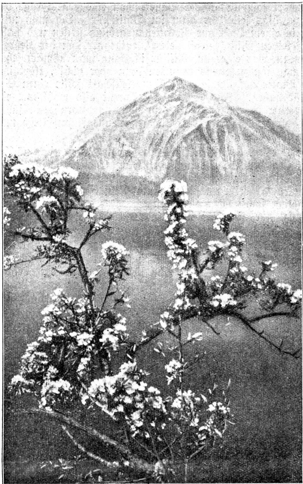
Mai-Idyll bei Gunten am Thunersee.