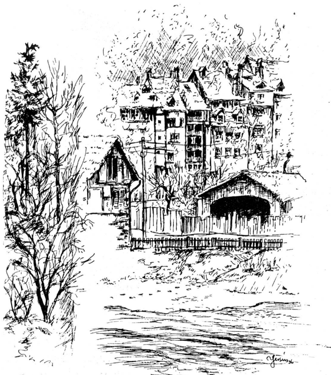
Beim Pelikan. Zeichnung von A. E. Yersin, Bern.

Franz hatte sich als Grandseigneur ausgespielt, war in einem erstklassigen Hotel vorgefahren, bestellte dem Kellner mit fürstlicher Geste einen reichen Imbiß, plauderte weltmännisch, zog die pralle Brieftasche hervor und bezahlte alles.