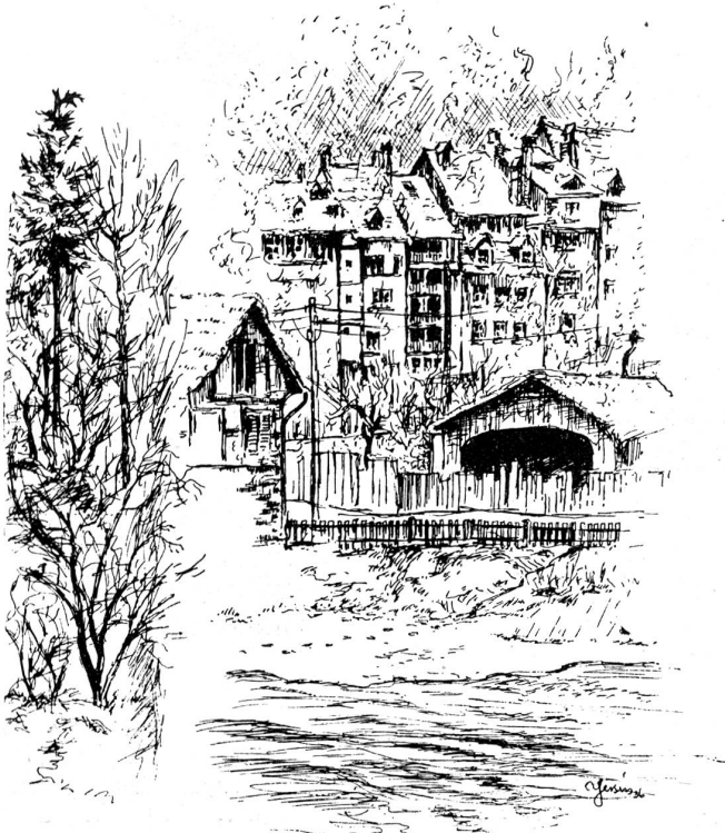
Beim Pelikan. Zeichnung von A. E. Yersin, Bern.

Franz hatte sich als Grandseigneur ausgespielt, war in einem erstklassigen Hotel vorgefahren, bestellte dem Kellner mit fürstlicher Geste einen reichen Imbiß, plauderte weltmännisch, zog die pralle Brieftasche hervor und bezahlte alles.