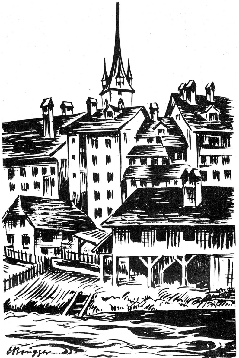
„Aus der Altstadt Bern“.

Er führte das Gespräch und schien manch trefflichen Gedanken für den Lehrer allein geprägt zu haben. Lothar ließ sich in die Plauderei hineinbeziehen. Sein Edelsinn überwand den tiefen Groll. So gab der Lehrer schließlich